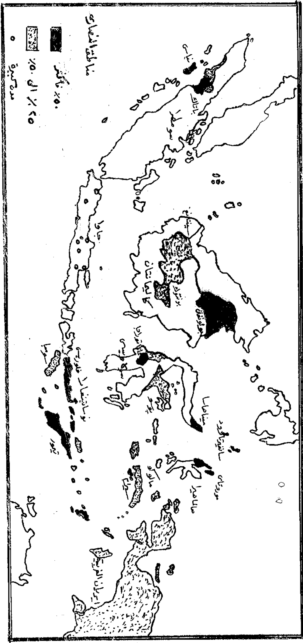
الخريطة الرابعة : المناطق النمرانية في عام 1971 م (1391 هـ)