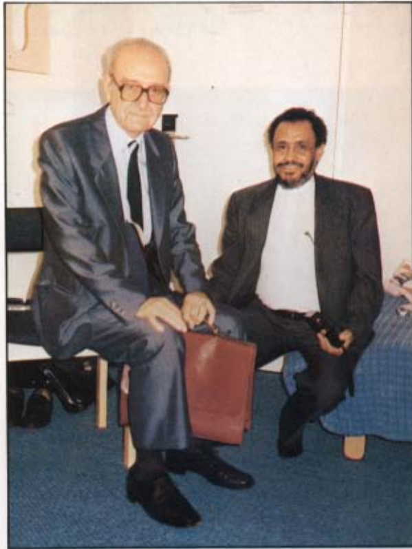
[٢٠] مع البروفيسور الفرنسي «رجاء جارودي» . باريس: ١٤٠٨ / ١ / ٢٣ هـ.