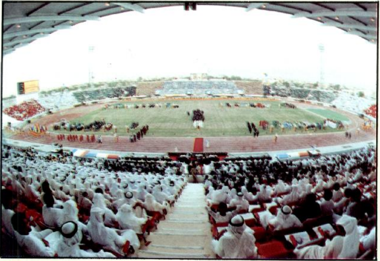
● ملعب نادي كاظمة في الكويت كما بدأ يوم الافتتاح الكبير.