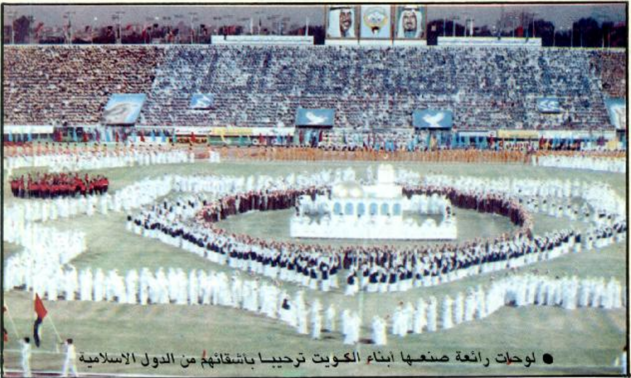
● لوحات رائعة صنعها أبناء الكويت ترحيبا بأشقائهم من الدول الاسلامية