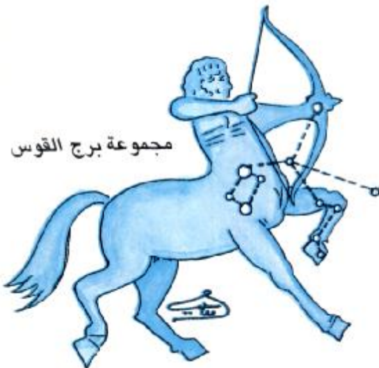
مجموعة برج القوس

عرف أجدادنا العرب كثيراً من المهارات والمعارف العلمية ومهروا بها بصورة رائعة واشتهروا بها ولقننا الآباء للأبناء والأجداد للأحفاد ومن هذه المهارات القيادة والفراسة والعرافة والريافة وملاحظة النجوم وأسماء الماء وأنواع السحب وإيقاد النار وسوف نقدم لكم أحبائنا البراعم في هذه الحلقة الرابعة نبذة مختصرة عن ملاحظة النجوم.