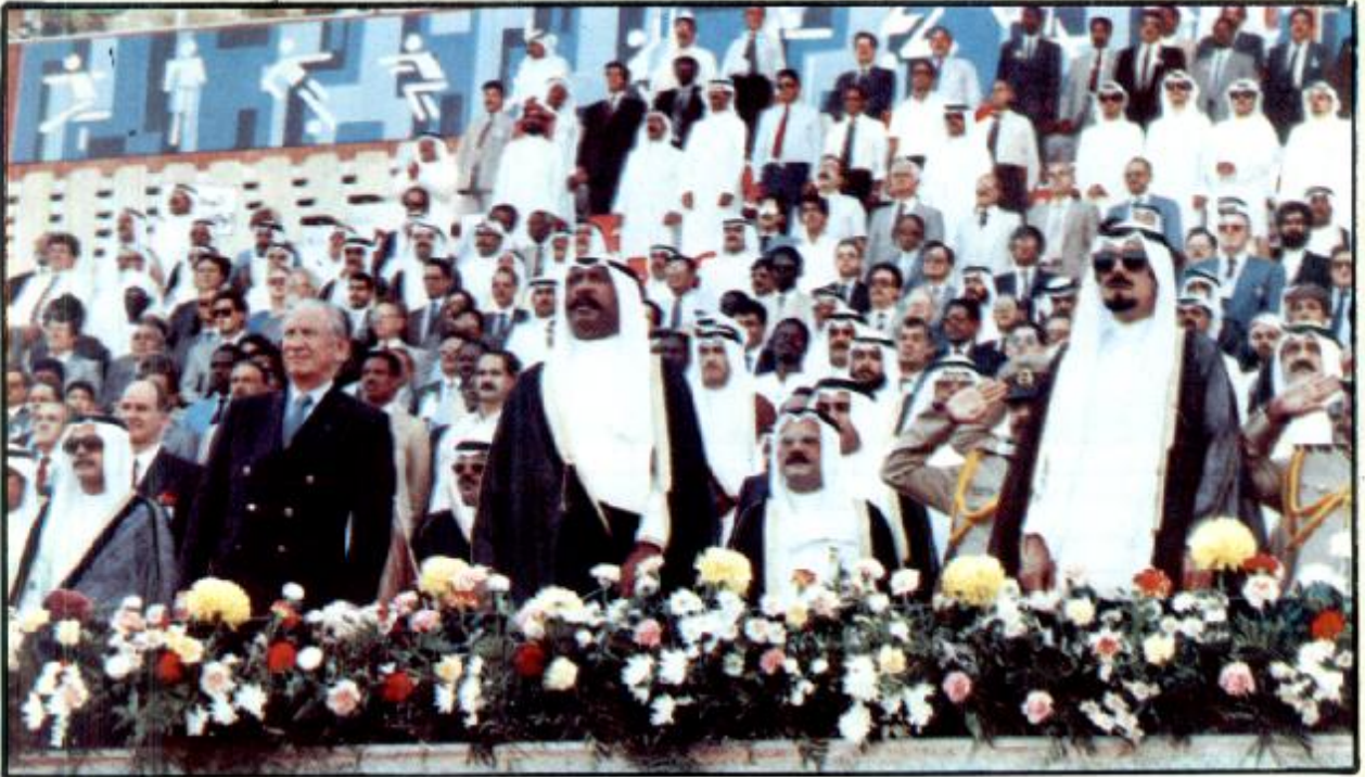
● أمير البلاد الشيخ جابر الاحمد وسمو ولي العهد الامين في حفل افتتاح الدورة