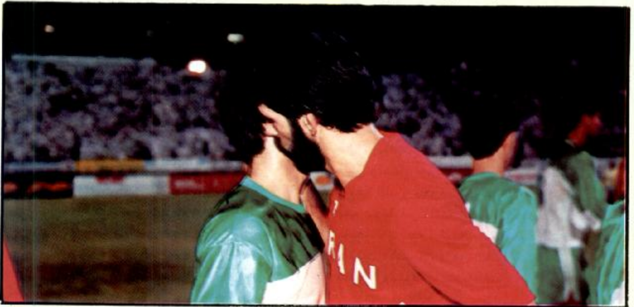
● الشباب المسلم في ايران والعراق يتعانقون عنق المحبة والسلام