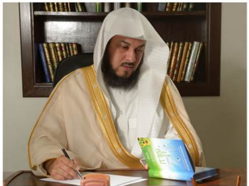
دکتر محمد بن عبدالرحمن العریفی