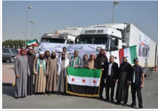
جمعية إحياء التراث ترسل شاحنات من المساعدات للأشقاء السوريين في تركيا