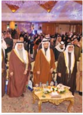
مؤتمر الأمانة العامة للأوقاف