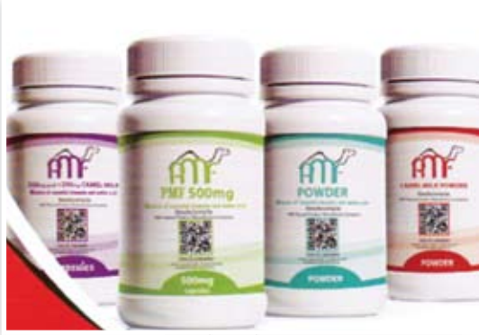
د. فائق خورشيد تكتشف علاجاً جديداً يدمر الخلايا السرطانية دون التأثير على الخلايا السليمة