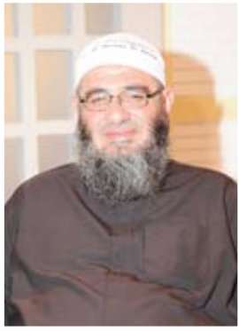
حوار مع الشيخ مشهور حسن