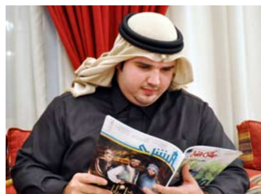
• الشيخ مالك آل فهد المالك السلطان الصباح

أما الشيخ "نمر" فيتحدث عن لجنة التعريف بالإسلام قائلاً: اللجنة من اللجان المشهود لها داخل دولة الكويت، لها سمعة طيبة وتاريخ قديم، لها أعمال خيرية كثيرة تقوم بها، ودخول أكثر من 4 آلاف شخص للإسلام في العام الماضي يدل على أن الإسلام دين تسامح ودين رافة، ودين تعاون، وهذا ما يحثنا عليه ديننا، فأصحاب الديانات الأخرى عندما يرون سماحة الدين الإسلامي، وتكافله مع الآخرين، واهتمامه بالإنسان، سواء كان مسلما أو غير مسلم، فالكل سواسية ولهم حقوق وعليهم واجبات، فهذا بلاشك يشجعهم على الدخول في الدين الإسلامي واعتناقه، والإحصاءات تبين أن الدين الإسلامي ينتشر بشكل سريع في جميع دول العالم،