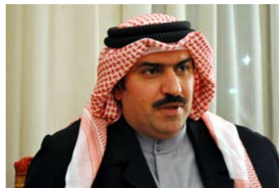
• الشيخ أمير آل فهد المالك السلطان الصباح

وكتب لهم مبلغ الترميم، ووقعت باسمي، فقال لي: أخبرك صدقاً؟ والدك هو من رمم المسجد قبل 20 عاماً.. وهذا الشيء كان حدثاً سعيداً بالنسبة لي، فمهما مضى من الوقت فعمل الخير لا ينسى.