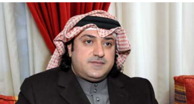
• الشيخ مبارك آل فهد المالك السلطان الصباح