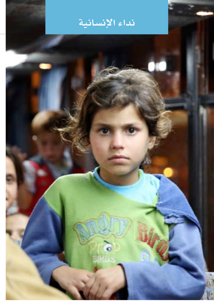
• «النداء الموحد» يطلق صحبكات الإغاثة عبر تلفزيون الكويت