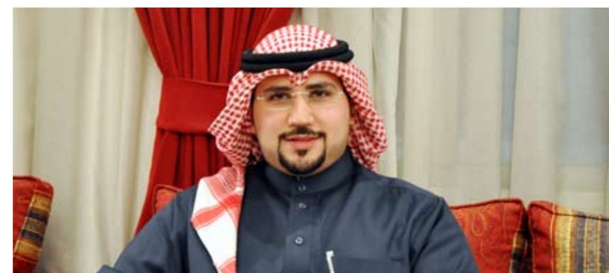
• الشيخ سلطان آل فهد المالك السلطان الصباح

أو غير المسلمين، فأنشطتها الدعوية بادية للعيان من الجهراء شمالا إلى الوفرة جنوبا، وبفضل الله توتيت ثمارها سنويا من خلال ما نسمعه من إحصاءات تخطت 4 آلاف شخص يدخلون الإسلام سنويا، وما كان ذلك ليتحقق لولا أن هذه اللجنة المباركة تسير وفق منهج نبوي كريم، ممثلة في ذلك قوله تعالى: ﴿ادْعُ إِلَى سَبِيلِ رَبِّكَ بِالْحُكْمَةِ وَالْمَوْعِظَةِ الْحَسَنَةِ وَجَادِلْهُمْ بِالَّتِي هِيَ أَحْسَنُ﴾.