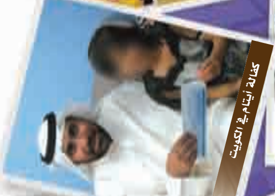
كتابة أيتام في الكويت