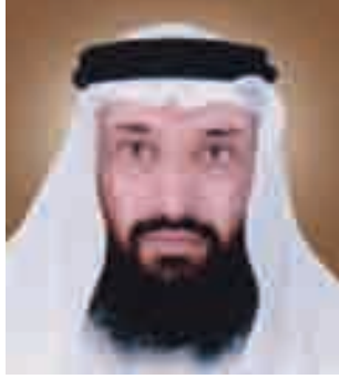
حمود الرفياعي داعية إسلامي