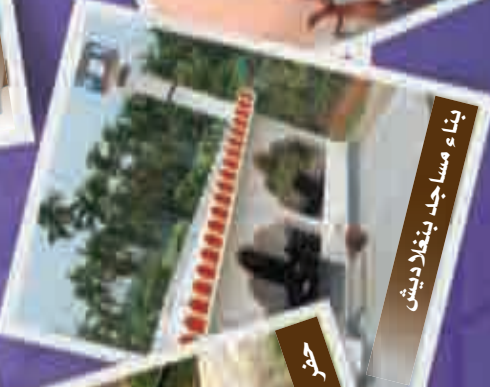
بناء مساجد بنغلاديش