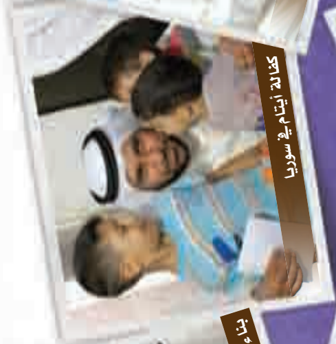
كتابة أيتام في سوريا