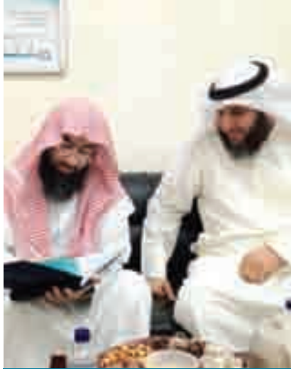
الشيخ نبيل العوضي أثناء الزيارة

مختلف اللغات، بالإضافة إلى الوسائل الدعوية المتنوعة.