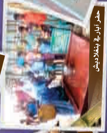
حفر آبار في بنغلاديش