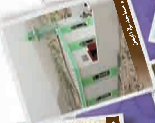
بناء مساجد في اليمن