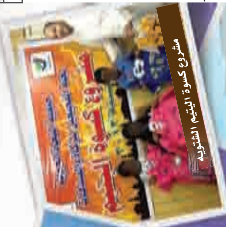
مشروع كسوة اليتيم الشتوية