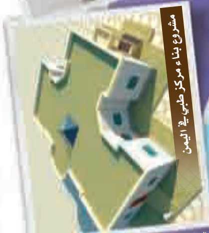
مشروع بناء مركز طبي في اليمن

لجنة الفحيحيل جمعية النجاة الخيرية للزكاة والصدقات