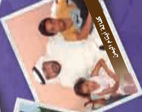
مستشار لادارة اذاعة