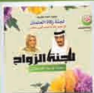
الزواج ومكافحة العنوسة