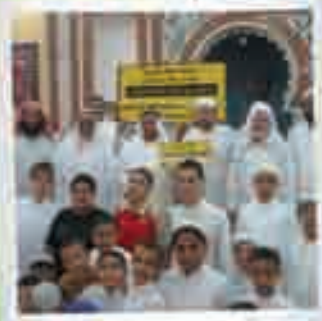
مراكز القرآن الكريم