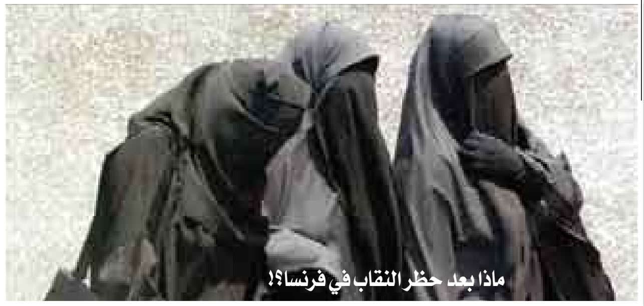
ماذا بعد حظر النقاب في فرنسا؟!