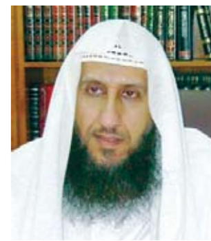
د. محمد الحمود النجدي داعية إسلامي

قال شيخ الإسلام أحمد بن تيمية رحمه الله تعالى: والقرآن فيه من ذكر أسماء الله وصفاته