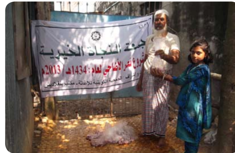
توزيع الأضاحي في بنغلاديش