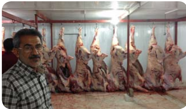
أضاحي لجنة زكاة سلوى في «كشمير»