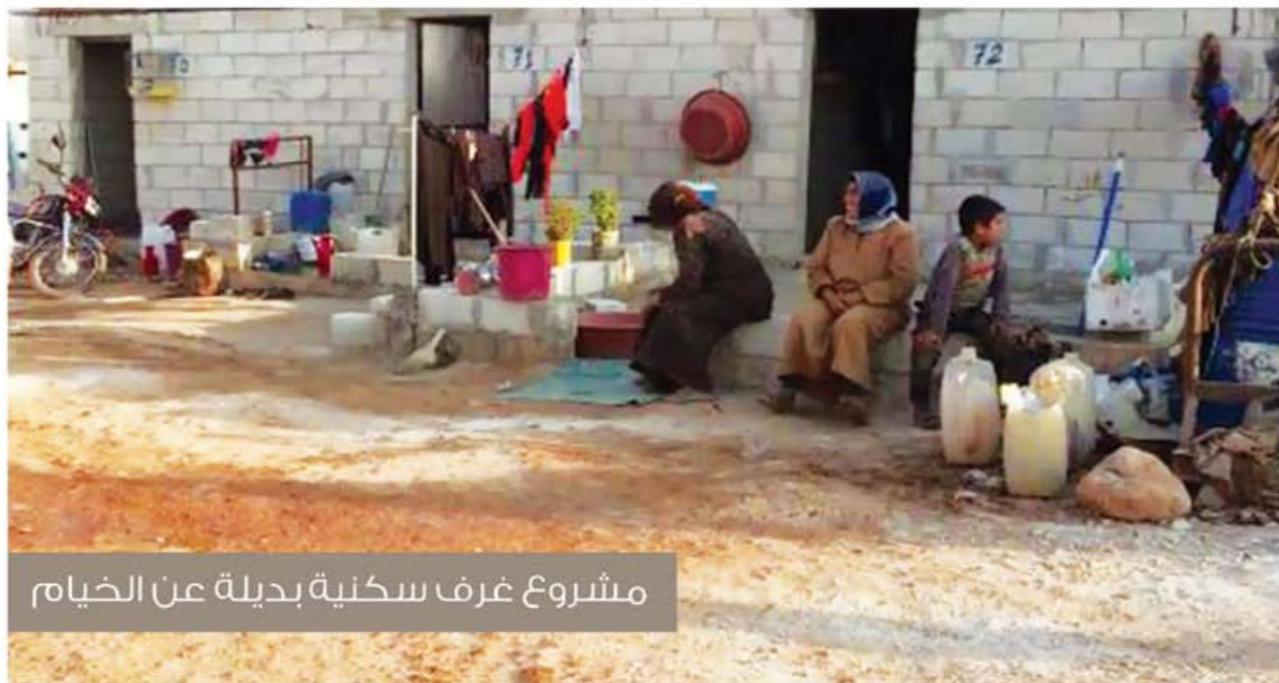
مشروع غرف سكنية بديلة عن الخيام

الرحمة العالمية RAHMA INTERNATIONAL جمعية الإصلاح الاجتماعي التميز في العمل الخيري