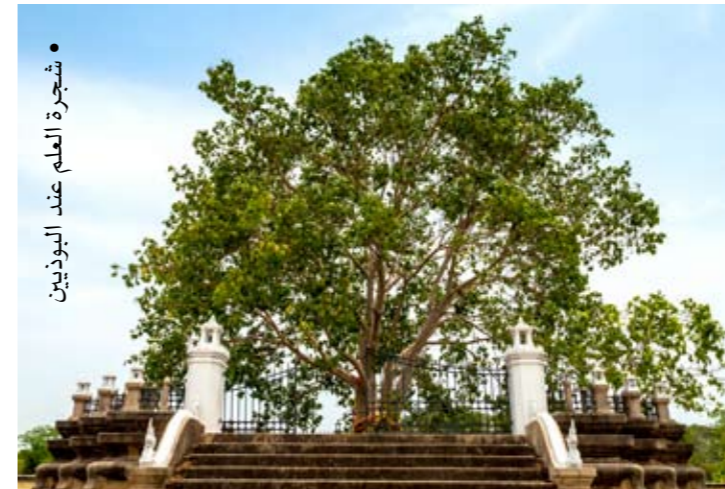
• شجرة العلم عند البوذيين

تحدثنا في الفصل السابق عن نشأة «بوذا» ومولده وحياته وانتهينا إلى أن «بوذا» مال إلى شجرة في غابة «أرويللا» -التي أصبح يطلق عليها الآن غابة بوذاكيا ذلك بسبب الإشراق التي حدثت له- (1) ليتفيا ظلّالها وحدث له ما كان يتمناه من إشراقات أو ما يسميه البوذيين «الزرفانا» وهي السر أو الحل لكل هذه الآلام. والتي كان يتمناها واستحوذت عليه وتملكته، ومن هنا أصبح سذاتا هو «بوذا» (أي العارف المستيقظ، والعالم المتور)، وأصبحت الديانة يطلق عليها «البوذية»، وأما الشجرة التي كان «بوذا» يجلس تحتها وحدث له الكشف المزعوم، فقد سميت بـ «شجرة العلم»، أو شجرة المعرفة، وقد احتلت عند البوذيين مكانة سامية، مثل مكانة الصليب عند المسيحيين، وإذا كان المسيحيون قد نشروا الصليب في حياتهم ورسموه على أجسامهم، وعلى جدران كنائسهم، فإن البوذيين يرون في الشجرة المقدسة شيئا يجب أن يسعى له الناس، ولهذا زرعوا في كل قطر شجرة واحدة من نوع الشجرة المقدسة يحج الناس إليها، في مناسبات مختلفة، وفي معبد «بروبودور» بالقرب من جاكرتا بإندونيسيا توجد الشجرة الوحيدة في «جاوة» من هذا النوع، والبوذيين