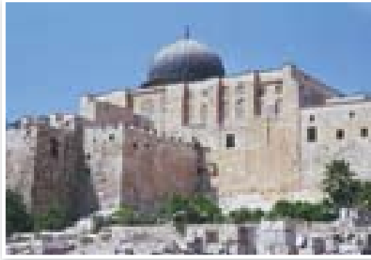
صرخة من أجل المسجد الأقصى