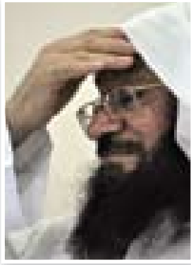
وترجل شيخ السلفية عبدالله السبت