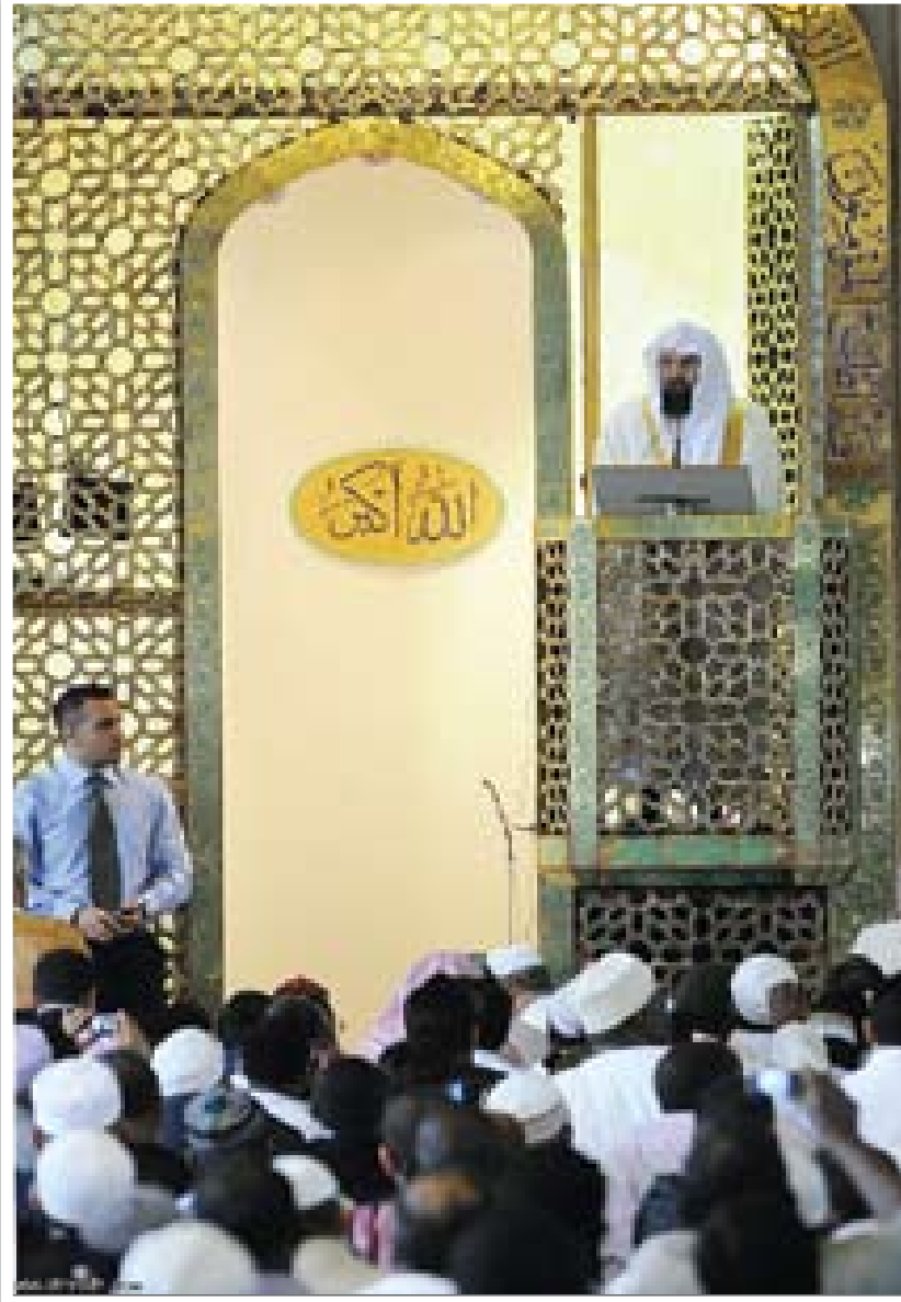
حفظه الله الشيخ السديس في زيارة له في إحدى دول إفريقيا

محفوظة وخلافاته مستورة، لا تُفشى ولا تُستقصى، قال ﷺ: «إِنَّ مِنْ أَسْرِّ النَّاسِ عِنْدَ اللَّهِ مَنْزِلَةً يَوْمَ الْقِيَامَةِ الرَّجُلُ يُفْضِي إِلَى امْرَأَتِهِ وَتَفْضِي إِلَيْهِ ثُمَّ يَنْشُرُ سِرَّهَا»، أَخْرَجَهُ مُسْلِمٌ مِنْ حَدِيثِ أَبِي سَعِيدِ الْخَدْرِيِّ. إن البيت المسلم يُقيم علاقاته مع المجتمع على أساس الإيمان، إنه يزداد نوراً بزيارة أهل الصَّلاح، فالمؤمن كحامل المسك؛ إما أن يعطيك، وإما أن تشتري منه، وإما أن تجد