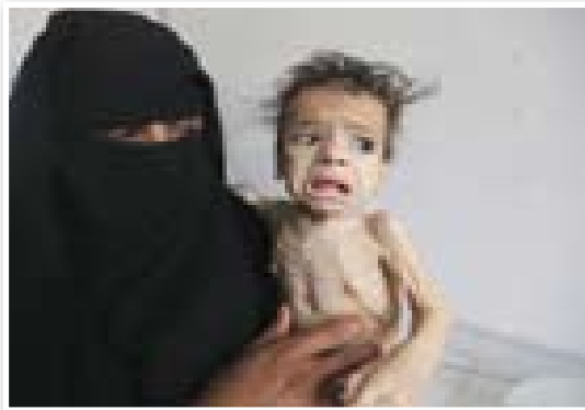
إحياء التراث نفذت حملتها لإغاثة المتضررين من المجاعة في اليمن

● كلمات في العقيدة: العادات.. المطلوب.. أداء الفرائض وترك الكبائر ١٣