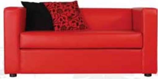
صوفا بمقعدين Clea