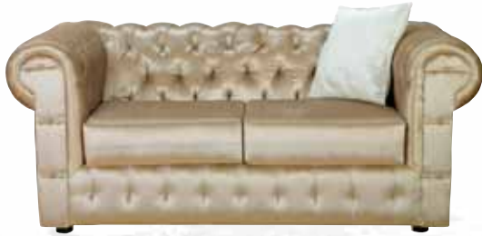
صوفا بمقعدين Haydi