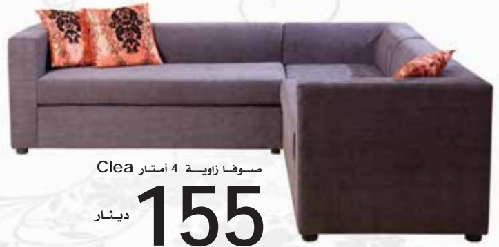
صوفا زاوية 4 أمتار Clea