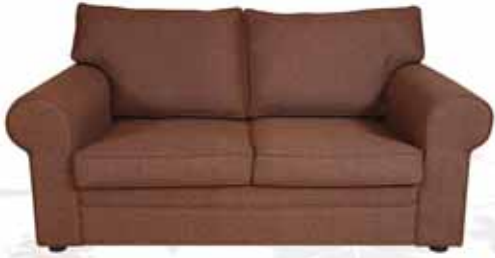
صوفا بمقعدين Oasis