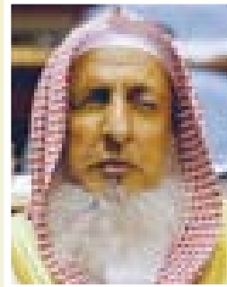
■ الشيخ عبدالعزيز آل الشيخ

ورأى المفتي أن الأمر العظيم الذي عكسته هذه الحادثة طأطأ رؤوس كثير من الذين يزعمون أنهم ليسوا منحرفين، وأظهر كمائن نفوسهم، وعرفوا أنهم قد دمغوا بهذا الباطل الذي كانوا يخفونه، والآن انكشف الغطاء وتبين ما هم عليه من