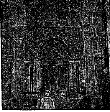
من صور الفن الإسلامي بأحد مساجد بنزرت في تونس