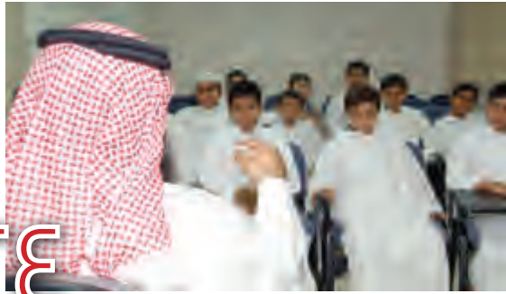
مسؤوليات المعلم (١-٢)