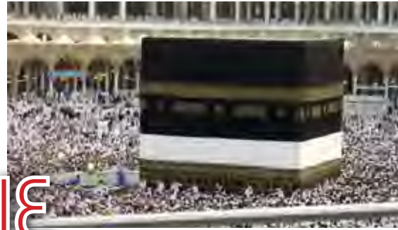
مواقف وأحكام في الحج

٢٢ • مسارات أسرية: لماذا احتواء المشكلات وليس حلها