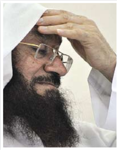
الشيخ عبدالله السبت رحمه الله

هو فرية - خواطر دعوية - همسات دعوية - حكم العمل الجماعي - دعوة للتأمل - العواصم من تلبيس إبليس على المتعلم والعالم - ضرورة التناصح بين الدعاة.