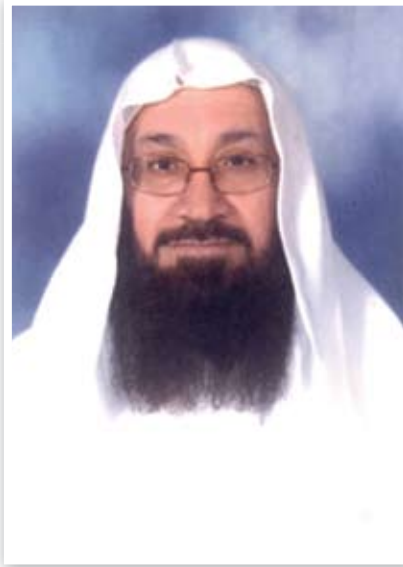
الشيخ عبدالله السبت رحمه الله

اختار الشيخ - رحمه الله - الإقامة في إمارة الشارقة مدة من الزمن ولم يبتعد كثيرا عن الكويت، فكان يزورنا ونزوره، وكان حريصا على الدعوة في الكويت وخارجها، وفي بادرة كريمة من دولة الكويت تقديرا لجهود الشيخ في رفع اسم الكويت في المشاريع الدعوية في شتى دول العالم ومحاربة الأفكار المتطرفة التي تفسد عقول الشباب وتبعدهم عن طريق الصواب، تم منح