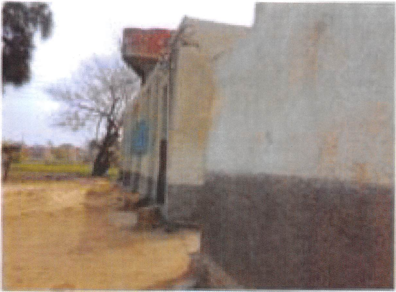
شکل رقم 4