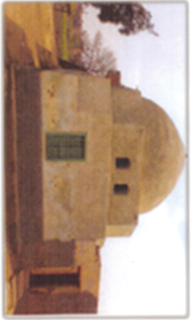
شكل رقم 1