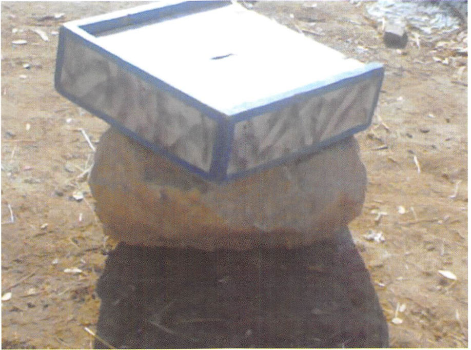
شکل رقم 3