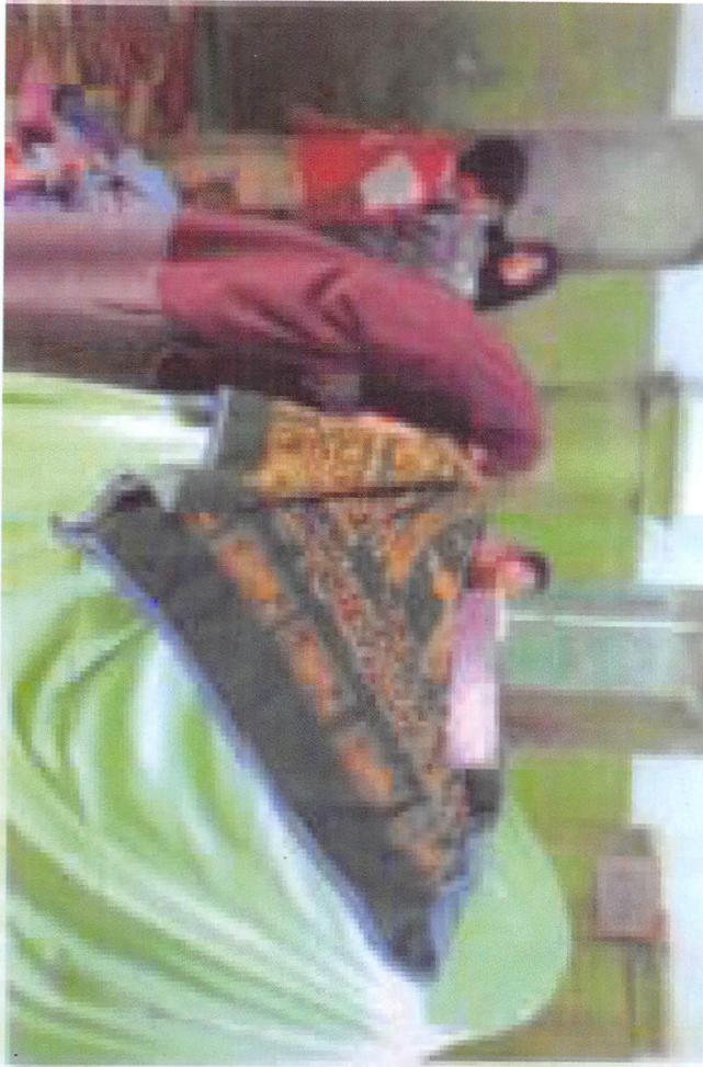
شکل رقم 6