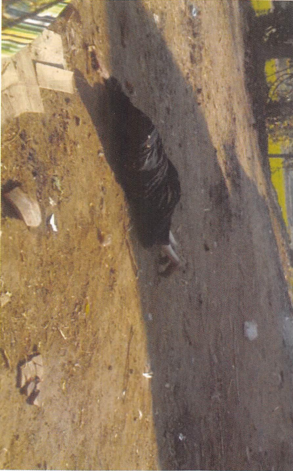
شكل رقم 5